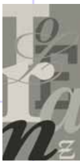
Motiv: Linda Orgen-Rhein

Nähere Informationen im Gemeindebüro T. 0231 - 14 18 95